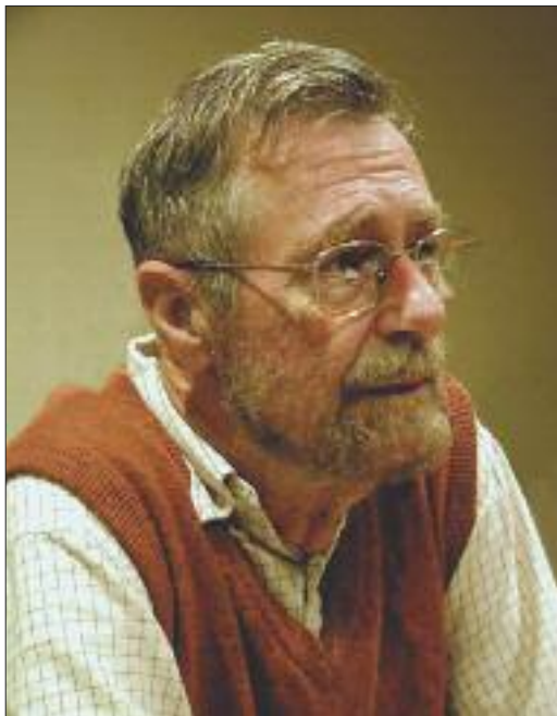
Edsger Wybe Dijkstra

quali sono le istruzioni che mette a disposizione e non come sono state realizzate. È evidente come, da subito, Dijkstra era sensibile a quelli che più tardi sarebbero stati chiamati principi di progettazione del software. L'ARMAC è del 1956. Dijkstra scrisse il software 14 , Loopstra e Scholten progettarono l'hardware: